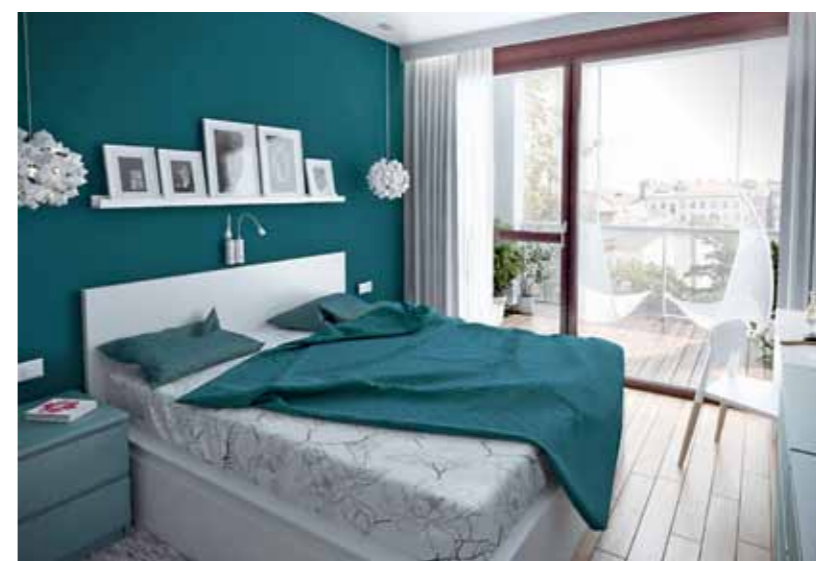
Zdjęcia: dzięki uprzejmości pracowni Home & Style; grafika: Kaja Kowacz (2)

Ciemnoturkusowa ściana daje wrażenie głębi, poprawia proporcje wnętrza. Na jej tle wezgłowie łóżka, półka i lampy zyskują na wyrazistości. Podwieszana szafka przy oknie pełni funkcję toaletki. Podłoga z dębowych olejowanych desek przechodzi na tarasie w kompozyt w tym samym wymiarze i kolorze.